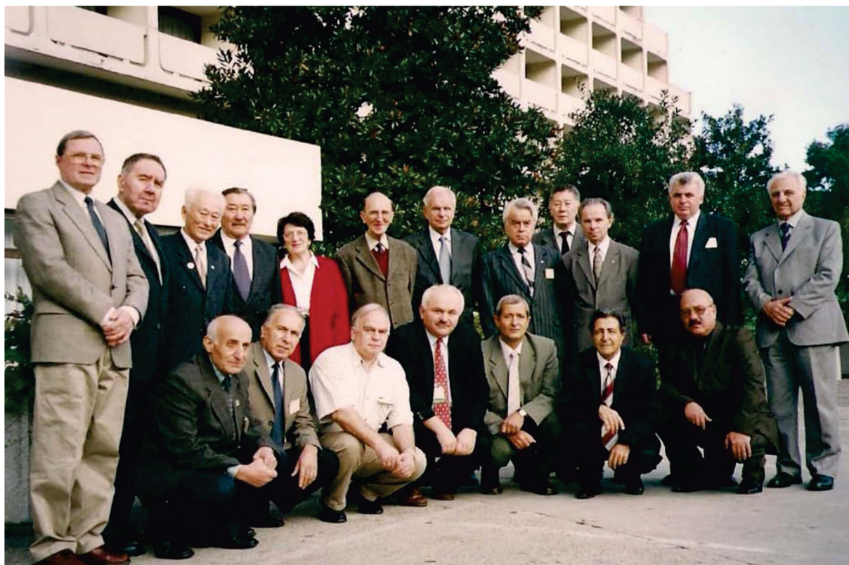
Участники Учредительной конференции Союза физиологических обществ стран СНГ Сочи–Дагомыс, 11–12 октября 2003 года

И уже 3 декабря 2003 года Совет Международной ассоциации академий наук (МААН), рассмотрев ходатайство Союза физиологических обществ стран СНГ о принятии его в члены МААН, одобрил создание Союза, утвердил его Устав и постановил считать Союз физиологических обществ стран СНГ организацией, состоящей при МААН