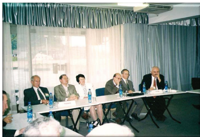
Президиум Учредительной конференции