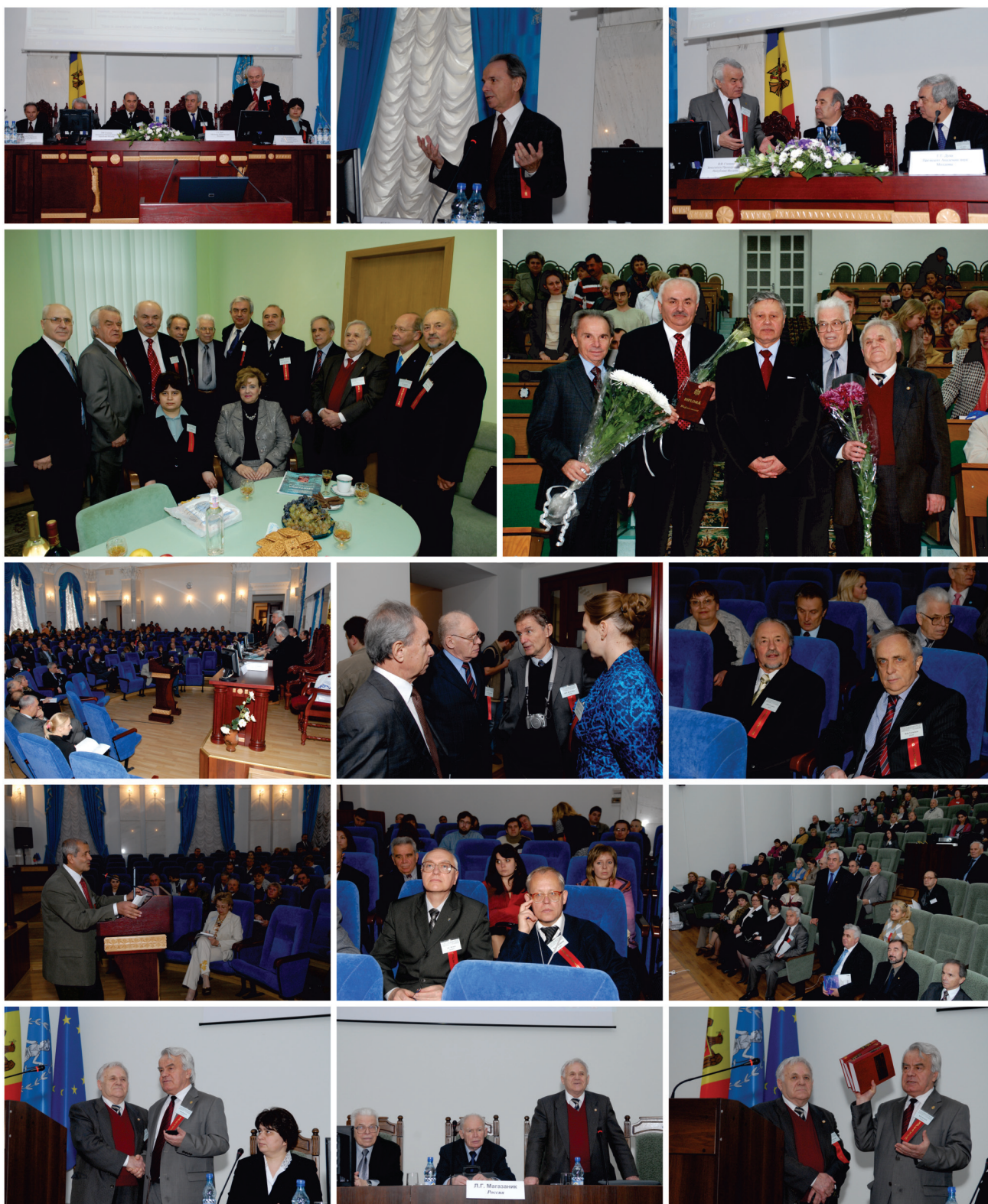
Торжественное открытие и научные заседания II Съезда физиологов СНГ (Кишинев, Молдова, 29–31 октября 2008 года)